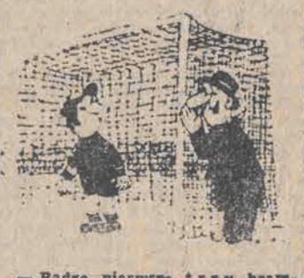
— Radzę pierwsze trzy bramki przyjąć ze świetnym spokojem. Niech przeciwnik uszka poczucie przewagi — a potem zobaczmy!