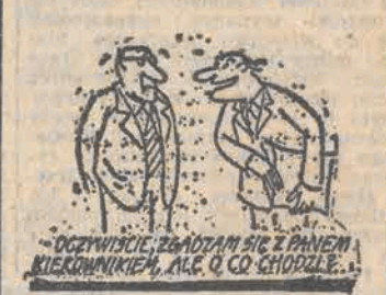
„Oczywiście, zażądał się z panem kierownikiem, ale o co chodzi?”