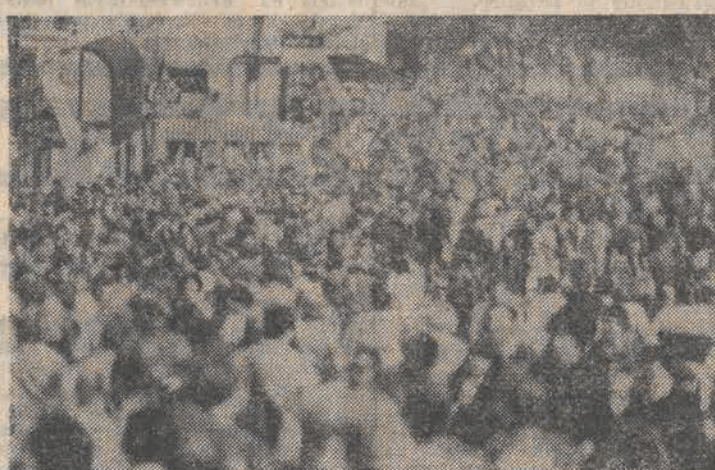
Korzystając z prawdziwie wiosennej pogody, tysiące paryżan wyległo na ulice miasta