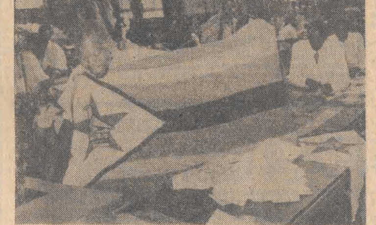
Wczoraj o północy została wciągnięta na maszt flaga niepodległego Zimbabw. N/z: przygotowanie nowej flagi w jednym z zakładów w Salisbury.