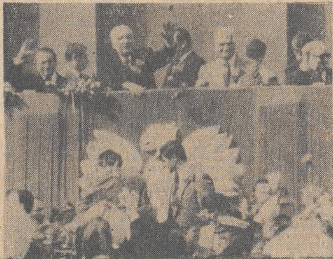
1 Maja w Warszawie. N/z: trybuna honorowa