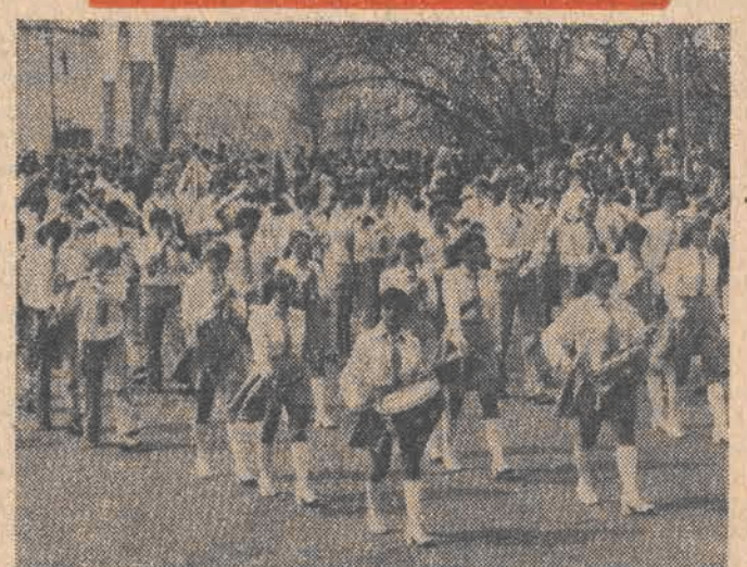
W 1-majowej manifestacji w stolicy woj. skierniewickiego udział wzięło ponad 30 tys. osób, mieszkańców samych Skierniewic, a także licznych delegacji z innych miast i gmin województwa. Barwny i radosny pochód trwał tu blisko 2,5 godziny, a szczególnie barwnie zaprezentowała się kolumna młodzieży ZSMP, ZHP i skierniewickich szkół.

Wydanie: A ŁÓDŹ, piątek, 2 maja 1980 roku Rok XXXVI nr 99 (9567) Cena: 1 zł