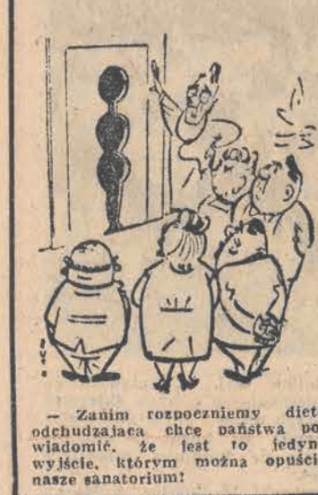
Zanim rozpoczniemy dietę odchudzającą, chcę państwa powiadomić, że jest to jedyny wyście, którym można opuścić nasze sanatorium!