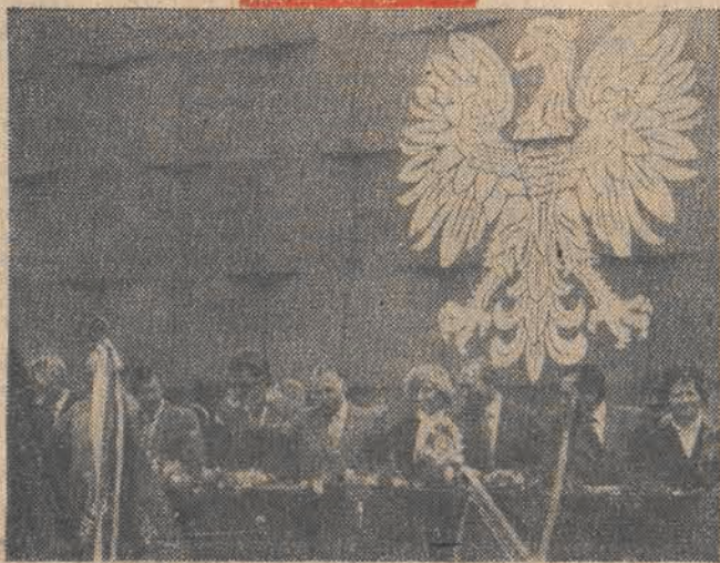
Przed trybuna honorowa w Łodzi w czasie tegorocznej manifestacji 1-majowej przemaszeraowało przeszło 300 tys. osób. Przez 5 godzin w barwnym radosnym pochodzie ludzie pracy, weterani walk o wyzwolenie narodowe i społeczne, młodzież manifestowali swe poparcie dla programu socjalistycznej Ojczyzny.