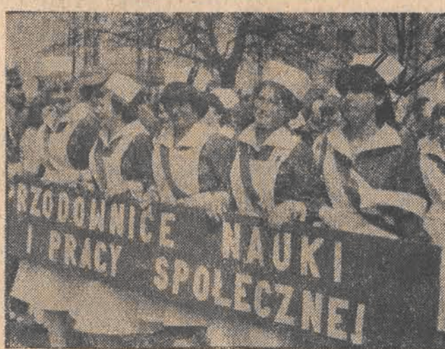
Pierwszomajowa manifestacja w Sieradzu przebiegała pod znakiem młodzieży. W barwnym pochodzie wzięło udział ok. 19 tysięcy sieradzian i przedstawicieli gmin: Sieradz, Wróblew i Brzeźno. Maszerują uczniowie Liceum Medycznego. W tej zastąpił szkołę uczy się 430 adeptów nietatowego zawodu pielęgniarki.