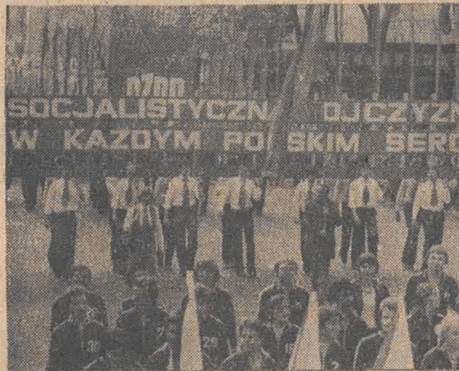
Sportowcy i członkowie ZSMP szli pod hasłem „Socjalistyczna Ojczyzna w każdym polskim sercu”.