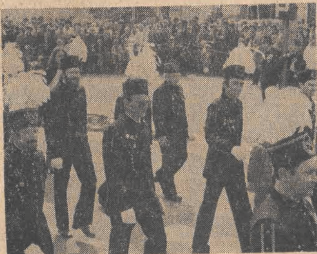
W pochodzie pierwszomajowym w Piotrkowie Tryb. uczestniczyło kilkadziesiąt tysięcy osób. Wśród nich znajdowali się również górnicy z Bełchatowa. Cały kraj czeka na pierwszy węgiel z KWB „Bełchatów” i prąd z pobliskiej elektrowni. Ma to nastąpić w ostatnim kwartale tego roku.