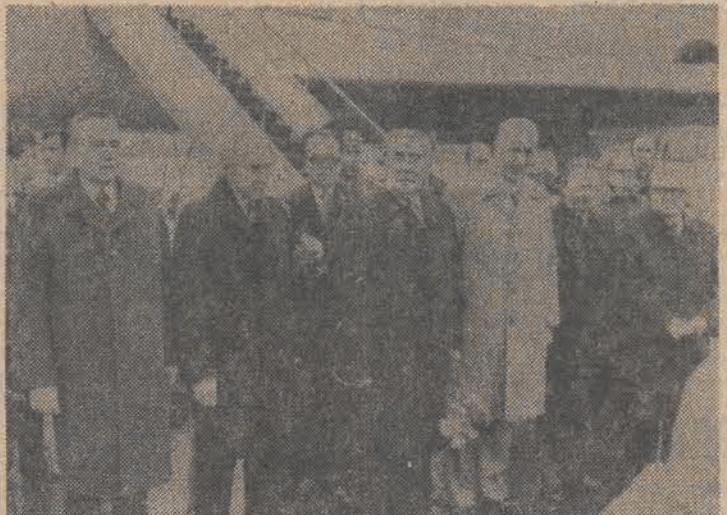
Powitanie delegacji radzieckiej z Leonidem Breżniewem na czele na warszawskim lotnisku Okęcie.

Delegacji bułgarskiej przewodniczy I sekretarz KC Bułgarskiej Partii Komunistycznej, przewodniczący Rady Państwa LRB — TODOR ZIWKOW, a w skład de-