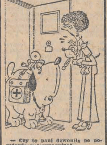
— Czy to pani dzwoniła po pogotowie weterynaryjne?