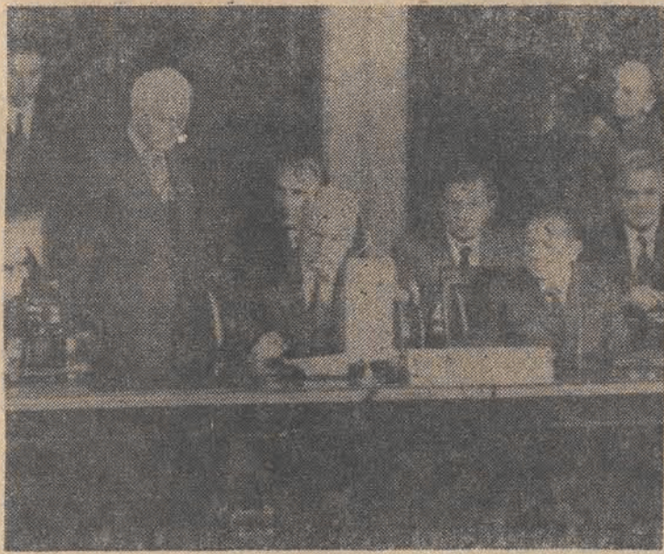
Przywódcy bratnich krajów członkowskich, przewodniczący poszczególnych delegacji, podpisali dokumenty końcowe narady. Niz: podczas podpisywania dokumentów końcowych przez Edwarda Gierka

Uroczystym podpisaniem dokumentów końcowych zakończyło się 15 bm. w Warszawie posiedzenie Doradczego Komitetu Politycznego państw — stron Układu Warszawskiego. Było to 17 z kolei spotkanie Komitetu, zwołane dokładnie w 25-lecie zawarcia w stolicy Polski Ludowej — socjalistycznego sojuszu obronnego.