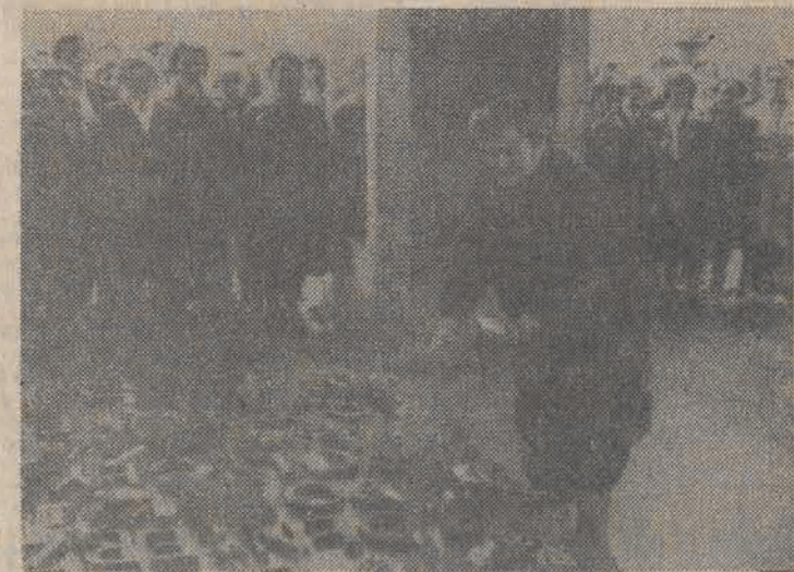
Przebywająca w Warszawie delegacja matek z terenu Polski, złożyła wieniec na Grobie Nieznanego Żołnierza.