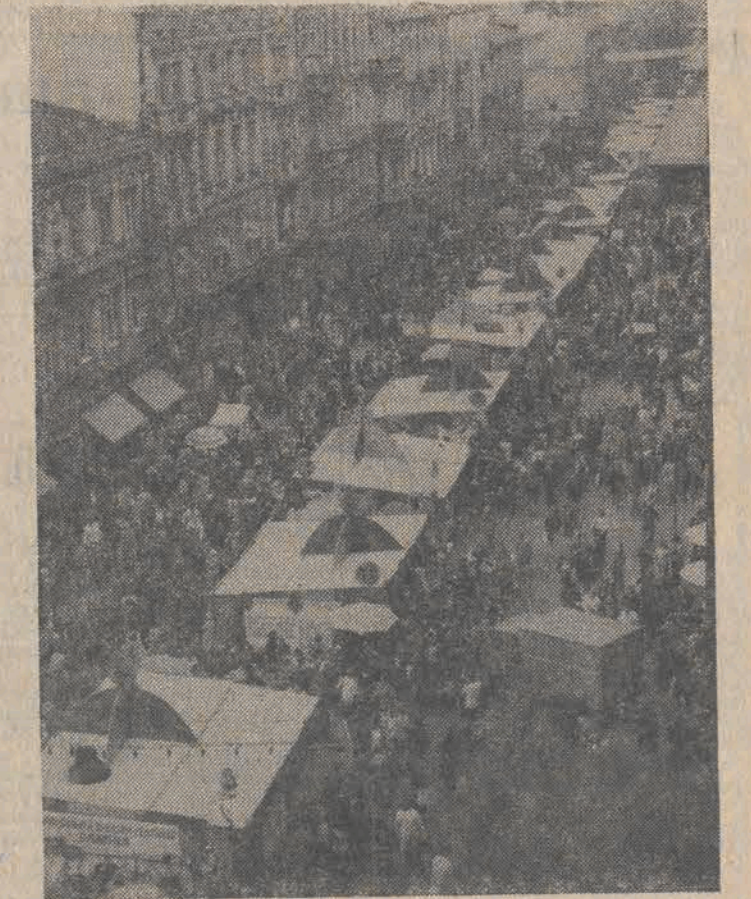
Stragany Jarmarku Łódzkiego na ul. Piotrkowskiej