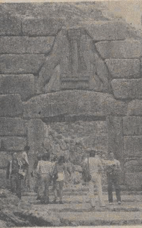
MYKENY — jedną z osobliwości Myken jest tzw. Brama Lwie datowana na XV w. p.n.e. z reliefem przedstawiającym dwie lwice wsparte przednimi łapami na cokole z kolumną