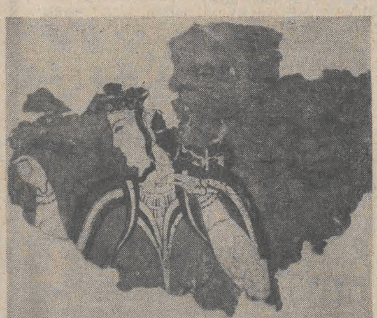
MYKENY — jedno z malowideł ściennych, które zachowały się w Mykenach