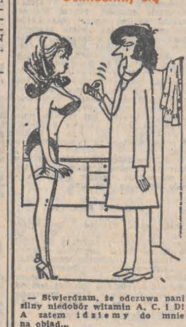
— Stwierdzam, że odczuwa pani silny niedobór witamin A, C i D! A zatem idziemy do mnie na obiad...