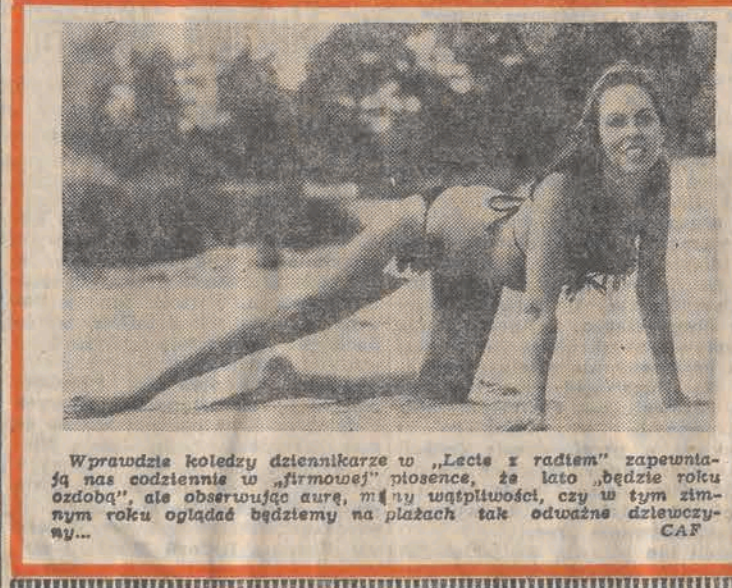
Wprowadźcie koleżdy do pracy w „Lectis z radem” zapraszają nas codziennie o „firmowej” piosenki, że lato „będzie roku ozdoba”, ale obserwując aury, mamy wątpliwości, czy w tym zimnym roku oglądać będziemy na plażach tak odważne dziewczyny...