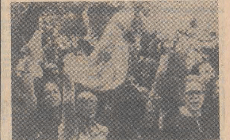
Przed rezydencją prezydenta Iranu, Bani Sadra odbyła się 6 bm. demonstracja kobiet, które protestowały przeciwko nakazowi noszenia przez nie tradycyjnych ubrań muzułmańskich i zakrywania twarzy kwefami.

Prokurator generalny Iranu opublikował oświadczenie, w którym ostrzega wszystkie kobiety, zatrudnione w urzędach państwowych i instytucjach rządowych, że zostaną niezwłocznie zwolnione, jeśli będą przychodzić do pracy w odzieży typu zachodniego.