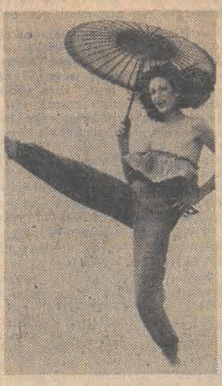
Radość tej pani gdzieś na południowych plażach jest zrozumiała — stołce i woda. Gdyby tak u nas trochę cieplej...

11.40 Tu radio kierowców. 12.05 Z kraju i ze świata. 12.25 Muzyka polskiej melodii. 12.45 Rolniczy kwadrans. 13.00 Komunikat energetyczny. 13.01 Przeboje na wakacje. 13.20 Komunikaty. 13.25 Gato Barbieri i jego muzyka. 13.40 Kącik melomana. 14.00 Studio „Gama” — wydanie kolobrozeskie. 14.20 Studio Relaks. 14.25 Studio „Gama”. 15.00 Wład. 15.05 Korespondencja z zagranicy. 15.10 Studio „Gama”. 15.20 Tu Jedynka. 17.30 Radiokurjer. 18.00 Tu Jedynka. 18.20 Komunikaty. 18.25 Nie tylko dla kierowców. 18.33 Kiermasz polskiej piosenki. 19.00 Dziennik wieczorny. 19.15 Przeboje sprzed lat. 19.40 Laureat Festiwalu Kapeli i Splewaków Ludowych. — Kazimierz 80. 20.00 Wład. i inf. dla kierowców. 20.05 Śladem naszych interwencji. 20.10 Orkiestra w repertuarze popularnym. 20.40 Mistrzowie nastroju. 21.00 Wład. 21.05 Kłanika sportowcy. 21.15 Komunikaty Totalizatora Sportowego. 21.20 Koncert Chopinowski — Zwycięzcy Konkursów Chopinowskich w W-wie — Halina-Czerna-Stefańska. 22.00 Z kraju i ze świata. 22.20 Tu radio kierowców. 22.23 Magazyn Kulturalny Programu I. 22.50 Koncert amatorów — Kołobrzeg 80. 0.01 Wład.