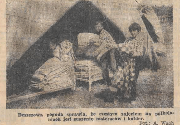
Deszczowa pogoda sprawia, że częstym zajęciem na półkoloniach jest suszenie materaców i kolder.