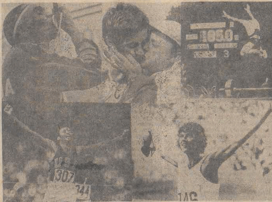
W dobie amerykański sprinter Tommy Smith w Meksyku na mecie finałowego biegu na 200 metrów, cieszy się ze złotego medalu i wspaniałego rekordu świata. I wreszcie — Jacek Wsioła, Montreal, 1976 rok. Bez komentarza.