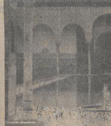
Z Malagi niedaleko do Grenady i cudów Alhamby, gdzie szmerzą cicho fontanny, gdzie naphalaistycznych turystów uciska i oszłamta piękno mauretańskiej architektury, gdzie czas zwalnia bieg, wplóczyły się w misterna steci alabastrowych koronek...