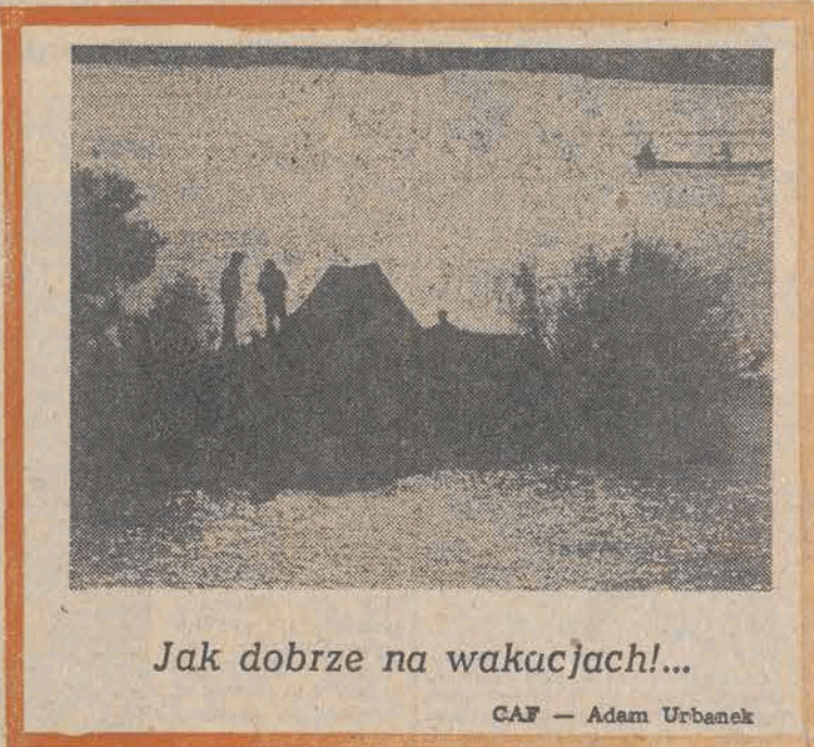
Jak dobrze na wakacjach!...

Podobnie jak w sprawie przemysłu, Manifest PKWN nie zawierał szczegółowych postulatów w sprawie odbudowy i rozwoju rolnictwa w Polsce, stąd i w tym przypadku słusznym jest sięgnięcie do Deklaracji PPR, w której czytamy, że plan gospodarczy w niepodległym kraju winien mieć na celu: Podniesienie rolnictwa na wyższy poziom przez szerokie zastosowanie nauki i techniki w gospodarce rolnej".