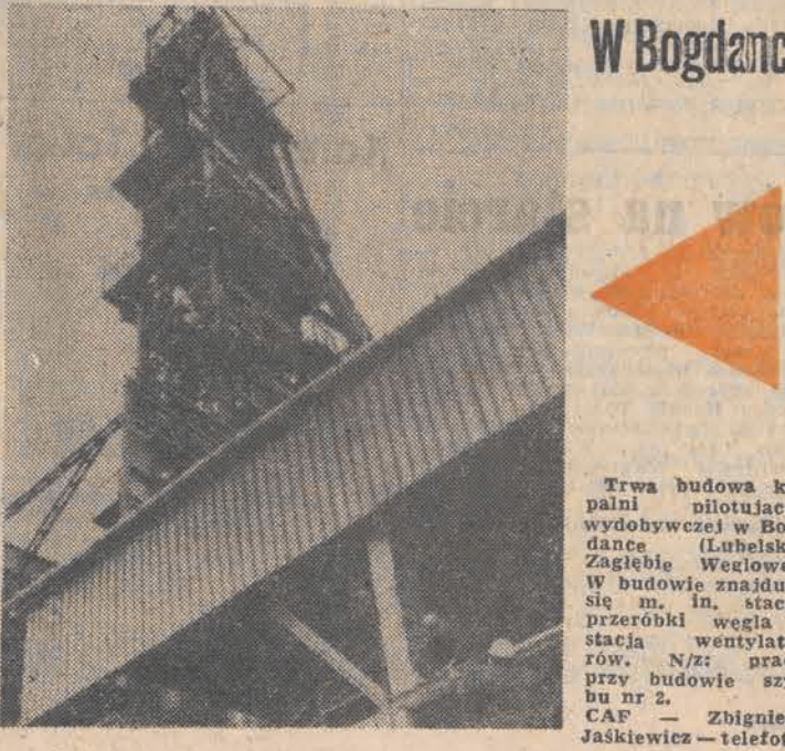
Trwa budowa ko-palni pilotująco-wydochowczej w Bog-dance (Lubelskie Zagłębie Węglowe). W budowie znajduje się m. in. stacja przeróbki węgla i stacja wentylato-rów. N/z: prace przy budowie szy-bu nr 2.

Do Łodzi nadeszła wczoraj z Rzymu niezwykle miła wiadomość, przekazana przez Komitet Wykonawczy Międzynarodo-wej Nagrody „Złotego Merkurego” — przyznawanej corocznie w innym kraju przedsiębiorstwom, zakładom i centrdom handlu zagranicznego za szczególne osiągnięcia w dziedzinie umacnia-nia międzynarodowej kooperacji i współpracy gospodarczej. Jednym z laureatów tegorocznej nagrody „Złotego Merkurego” zostało łódzkie Zjednoczone Przedsiębiorstwo Handlu Za-granicznego „TextilimpeXu”. Tegoroczna XX Konferencja „Złotego Merkurego” odbędzie się w październiku w Moskwie. Tam też nastąpi przekazanie laureatom szczerzłotych statuetek Merkurego jako najwyż-szego wyróżnienia w dziedzinie rozwoju kooperacji przemysło-wej i handlowej między krajami świata. Łódzka centrala, będąca największym eksporterem i importerm wyrobów pol-skiego przemysłu lekkiego, w ciągu 35 lat swej działalności dobrze zasłużyła na tę wysoką ocenę. W ramach RWPG jest ona inicjatorem wielu poczynań zmierzających do umocnienia więzi między organizacjami przemysłowymi i handlowymi nie tylko krajów socjalistycznych. Gratulując zatem łódzким handlowcom tego najwyższego wy-różnienia międzynarodowego, oczekiwaliśmy dalszej dy-namizacji działań w zakresie rozwoju eksportu i międzynaro-dowej kooperacji. (er)