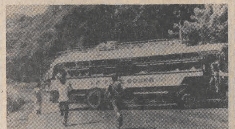
W Salwadorze utrzymuje się napięta sytuacja. Trwają walki między partyzantami i oddziałami wojsk rządowych. Na zdjęciu: partyzanci zatrzymujący autobus blokując drogi dojazdowe do stolicy.

Wydanie A ŁÓDŹ, piątek - 8, sobota - 9 i niedziela 10 sierpnia 1980 roku Rok XXXVI nr 171 (9639)