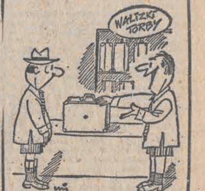
— A teraz pan wierzy, że do tej walizeczki wejdą dwa ubrania? (ms)