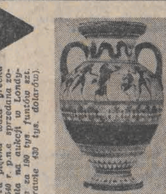
Ta piękna waza grecka z 540 r. p.n.e. sprzedana została na aukcji w Londynie za 190 tys. funtów sztet. (prawie 430 tys. dolarów).

ECHA II WOJNY ŚWIATOWEJ słyszane są do dziś w tartakach Pomorza Środkowego. Mówiono o tym niedawno na zjeździe uczestników walk o Wał Pomorski. Drzewa ścięte teraz w tej okolicy tak są nazępkowane wszelkimi śmieciami, że hamują się na nich tartaczne piły i tarki.