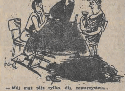
—Mój mąż płie tylko dla towarzystwa...