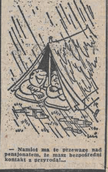
— Namlot ma te przeważa nad pensjonatem, że masz bezpośredni kontakt z przyrodą...