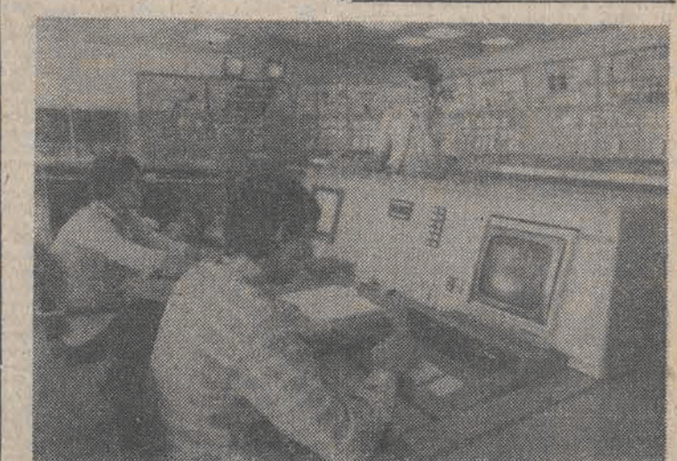
Cement jest jednym z podstawowych materiałów, wykorzystywanych w budownictwie. W br. największa krajowa cementownia „Górażdze” Koło Opola wyprodukuje go dla gospodarki 2 mln 100 tys. ton. N/Z: w centralnej sterowni.