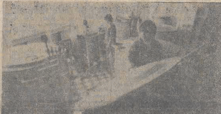
Nowy rok akademicki rozpoczął się 1 października. Na przyjęcie studentów przygotowano sałatkę, sale wykładowe. Także w domach studenckich wykonuje się ostatnie prace, m. in. montuje nowe meble, myje okna i inne. N/a; ostatnie prace w domu studenckim Politechniki Warszawskiej „Riviera” w Warszawie.