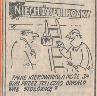
PANIE KIEROWNIKU, A MOŻE JA BYM PRZEZ TEN CZAS ODMALO WALE STODOLNICE?