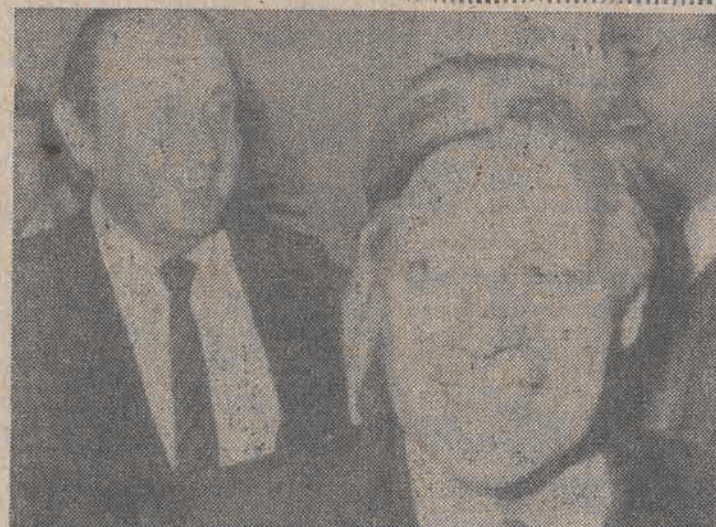
Uśmiechnięty kanclerz RFN, Helmut Schmidt i minister spraw zagranicznych, Hans Dietrich Genscher po zwycięstwie koalicji SPB-FDP w wyborach.