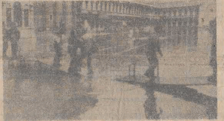
Wysoka fala morska spowodowała powódź w Wenecji. Przez pl. św. Marka można przejechać tylko po specjalnych kładkach.