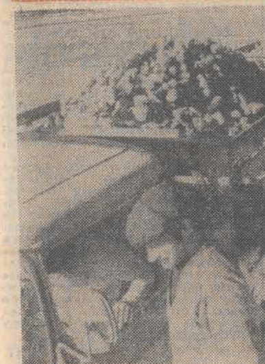
27 października rozpoczął się rozruch technologiczny w Cukrowni Ropczyce. Tym samym zapoczątkowana została pierwsza w historii nowego zakładu kampania cukrownicza. N/z: roślakunek buraków, przewiezionych od plantatorów.

W niedzielę — 26 bm. nad Szwecją przeszła radioaktywna chmura powstała w wyniku eksplozji jądrowej w atmosferze przeprowadzonej na terytorium Chin 16 bm.