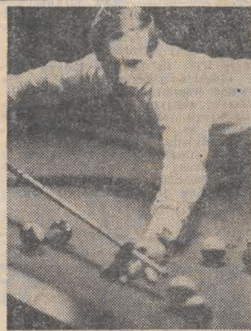
Nowa pozycja w słynnej Księdze Rekordów Guinnessa...