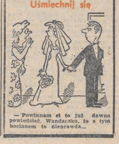
— Powinam ci to już dawno powiedzieć. Wstydźcie, że z tym bociem to nieprawda...