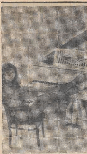
Węgierska piosenkarka Judit Szűcs.