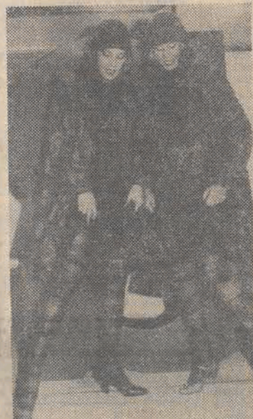
Dziwiarskie propozycje włoskiego domu mody Missoni.