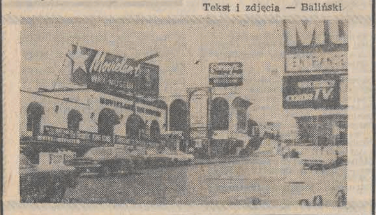
Tekst i zdjęcia — Baliński