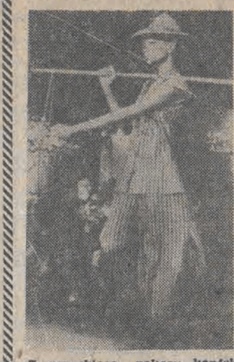
Z paryskiego pokazu konfekcji gotowej: bardzo szerokie rozcięcia z boku spodnie i bluzki z jedwabiu w różnobarwnych pasy — jedna z propozycji Japończyka Kenzo.

Budowa tunelu będzie gigantycznym przedsięwzięciem. Sek w tym, że inwestycja pochłonie ogromne