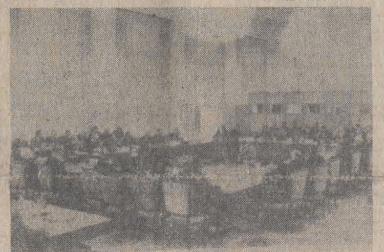
N.z.i. ogólny widok sali.

KC NSPJ, sekretarz KC, Herman Axen; członek Biura Politycznego KC NSPJ, minister obrony narodowej NRD, Heinz Hoffmann; członek Biura Politycznego KC NSPJ, minister bezpieczeństwa (Dalszy ciąg na str. 2)