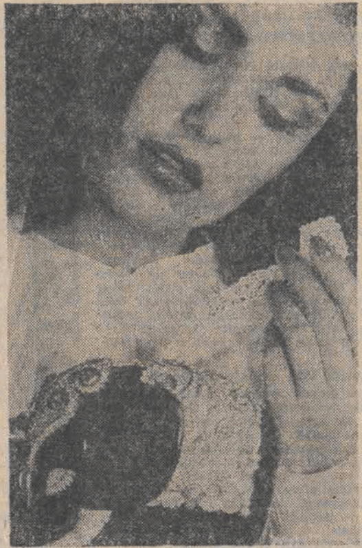
Ta wysadzana dyamentami o łącznej wadze 167 karatów, wieczorowa torebka w kształcie słońca należy niewątpliwie

Gdy w 1967 roku mała Carolina Kennedy miała honor być matką chrzestną lotniskowca Marynarki Wojennej USA, któremu dano imię jej zamordowanego ojca, flaszką z szampanem stłukła się dopiero za drugim razem. Obecni przy tej uroczystości powiedzieli, że to żył omen.