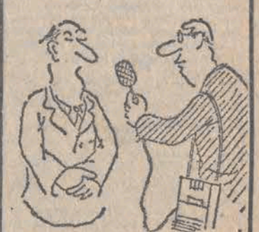
NIE WIEM JAK TO POWIEDZIEĆ ALE NIE MAM TEŻ PEWNE SUKCESY.