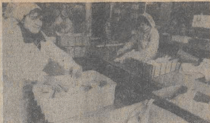
Gdańskie Zakłady Drobiarskie w Żukowie dostarczą rocznie na rynek 15 tys. ton drobiu białego i 170 mln sztuk jaj. Na święta sklepy zaopatrzone zostaną w około 1.800 ton kurczaków, indyków, gęsi i kaczek. N/z: wydział drobiarski.

Projekt polski przewiduje, ze do zadan pierwszego etapu konferencji nalezyc bedzie przede wszystkim opracowanie i przyjecie srodkow budowy zaufania; drugi etap bedzie podwójnym sukcesywności miedzy kolejnymi etapami.