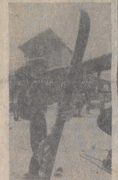
Trwająca od kilku dni, prawdziwa już zima, spowodowała liczne zakłócenia w komunikacji. Natomiast w Zakopanem na ulicach zamiast taksówek, pojawiły się sanie, a amatorzy białego szaleństwa oblegają kolejkę na Gubałówkę. N/z: na Gubałówce coraz więcej narciarzy.

W dniu 85 rocznicy urodzin przewodniczącej Komunistycznej Partii Hiszpanii Dolores Ibarruri I sekretarz KC PZPR Stanisław Kania skierował depesze z serdecznymi życzeniami i pozdrowieniami. (PAP)