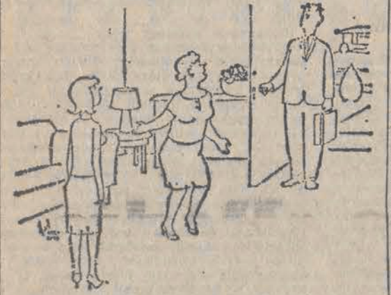
— To strasznie! Nasza Zosia przyjęła pracę w biurze, gdy wszyscy urzędnicy są już znanymi...

* SPECE z Ministerstwa Handlu i Zjednoczenia Przemysłu i Piekarniczego wymyślił, że trzeba nam oszczędzić życia i zakupili za granicą za 30 mln zł dziewięć maszyn, w które zamierzali wyposażyć siedem wielkich elastycznych rodokowców w różnych ośrodkach kraju. Urządzenia do produkcji ciast zaczęły nadchodzić, tymczasem jednak nie było gdzie ich ustawić, bo budynki kombinatów elastycznych nie istniały jeszcze nawet w projektach (np. we Wrocławiu, gdzie przewidziano, że każdy mieszkaniec będzie miał co roku 11 kg ciasta) Pod podzwętkę tej transakcji zażądała Prokuratura Generalna podziurawiając iż nie tyle chodzi o słodczy dla Polaków, ile o nie dość jeszcze sprzeciwiane interesy prywatne inżynierów. Wyświetleniem szczytów zajmie się wkrótce sąd.