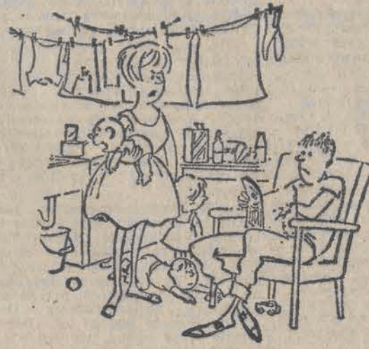
— Teraz, to już mnie nigdy nie zaberziesz do piwnicy, ani do Jazz Clubu...