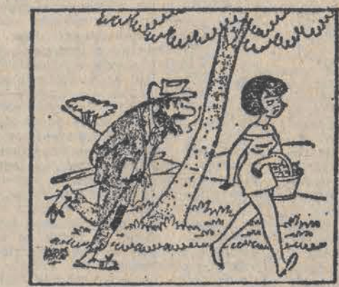
— Fanienska widziała już producenta filmowego? — Nie. — Właśnie to ja.

BARAN (21. 3. — 20. 4.): Zachowaj powściągliwość w wydawaniu opinii. Nie przyniesie Ci to ulgi, a wręcz przeciwnie wywoła przychylność otoczenia. Pod koniec tygodnia spotkanie w miłym gronie. BYK (21. 4. — 21. 5.): Nowe obowiązki i nowe zadania. Podejmując je nie zapomnij o zatawieniu wszystkich zaległych spraw. Samotni muszą zdecydować się ostatecznie czy obiekt ich westchnień mógłby się stać doznym towarzyszem życia. BLIŹNIĘTA (22. 5. — 21. 6.): Wszystkie argumenty przemawia-