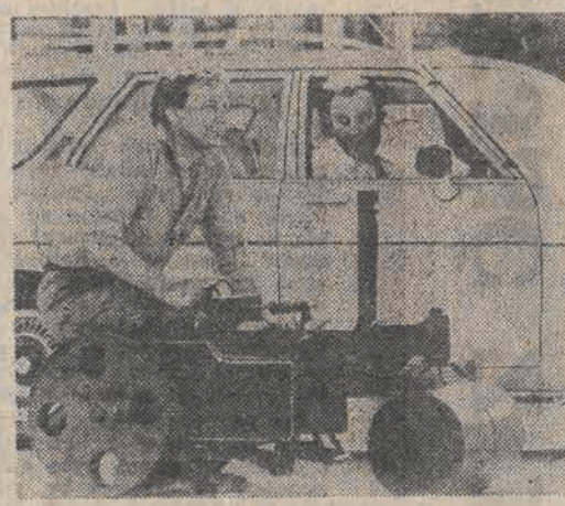
Zabawka z 1910 r. Miniatury walc parowy... na pedaly, wzbudził arosuniania sensacje na ulicach Sydney.