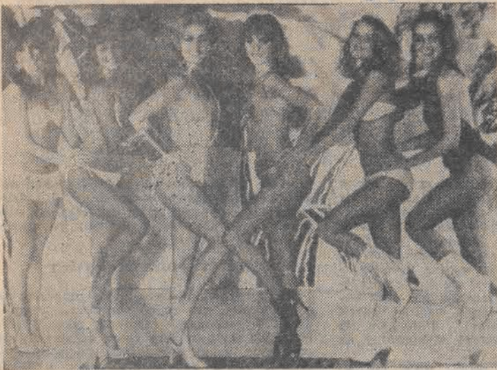
Dziewczeta znane w Anglii z telewizji jako grupa baletowa — tym razem pozują fotoreporterom na pokazie modnych na lato 81 kostiumów kąpielowych.