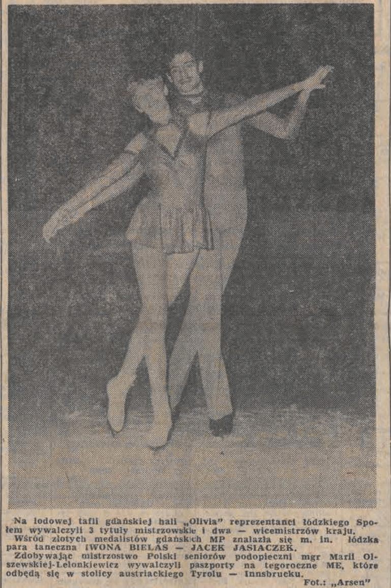
Na lodowej tafli gdańskiej hali „Olivia” reprezentanci łódzkiego Sportu wywalczyli 3 tytuły mistrzowskie i dwa - wicemistrzów kraju.