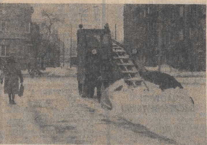
Wyjątkowo ubogie jest nasze miasto w sprzęt zmechanizowany do oczyszczania. Jeśli chodzi o tego typu urządzenia wykorzystywane do walki ze śniegiem...