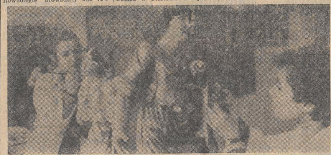
N/z: konserwatorzy z Olsztyna przywracają dawną świetność rzeźbom z zabytkowego kościoła w Rasymiu.