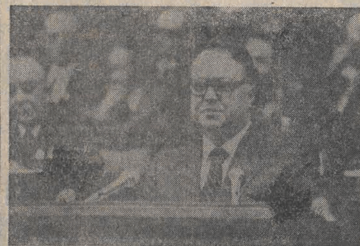
N/z: przemawia przewodniczący delegacji polskiej i sekretarz KC KPZR Stanisław Kania.