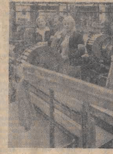
Kolejny raz w ciągu tych ostatnich miesięcy zamariła hala tkalni w ZPB im. Sz. Harnama