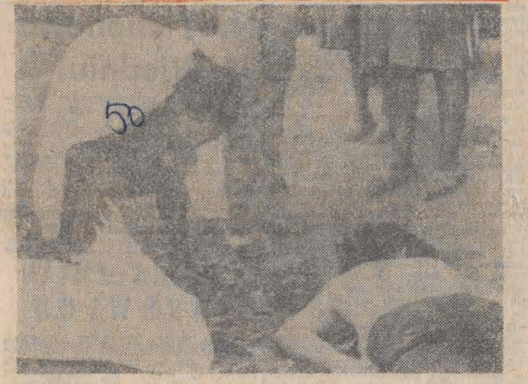
Na przedmieściach Salwadoru znaleziono ciała 24 osób zamordowanych przez salwadorską juntę...