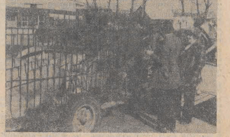
Podniesienie cen skupu żywności spowodowało wytrącenie ożywienia na punkcie skupu...