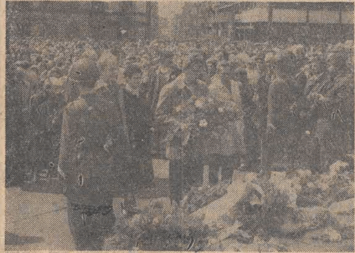
Pod Pomnikiem Tadeusza Kościuszki złożono wieńce i wianki kwiatów.