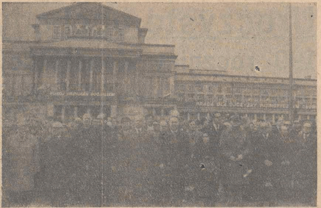
N/z: Na Placu Teatralnym w Warszawie podczas manifestacji.

Ważne o swej duchowej wierzcie i całym polskim narodem papież powiedział: „Pragnę jako syn tej samej ojczyzny przynieść do Ikonu Pani Jasnogórskiej to co jest naszą troską...”