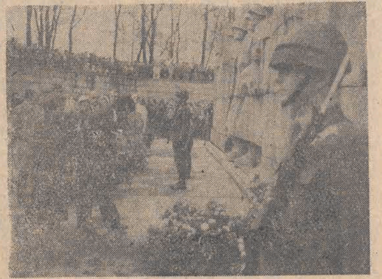
Delegacje licznych organizacji społecznych złożą pod pomnikiem wieńce i wianki kwiatów.