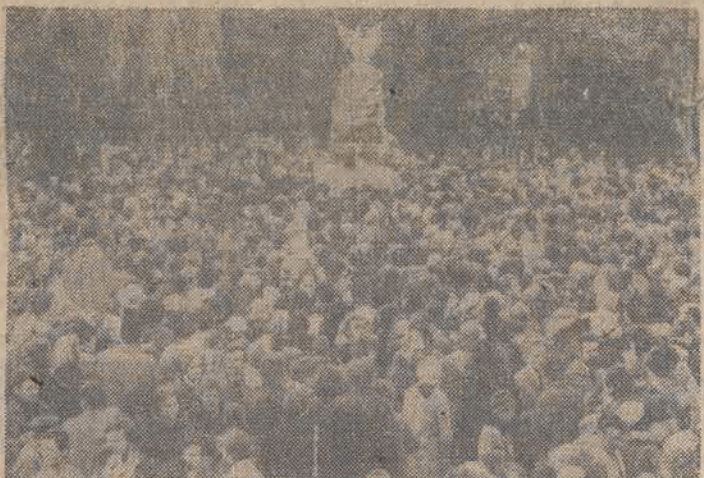
W uroczystości odsłonięcia pomnika upamiętniającego 190 rocznicę Konstytucji 3 Maja...