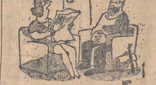
O twoim kumplu pisać, nawet zdjęcie jest, a ty co?