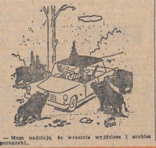
Mam nadzieję, że wreszcie wyjdiesz i zrobisz porządek.