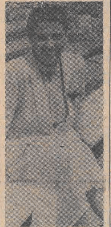
W tym miejscu należałoby pośpieszyć z wywodem o przelamywaniu barier, oporów, reklamie, zachęcie do oglądania...