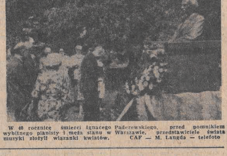
W 40 rocznicę śmierci Ignacego Paderewskiego, przed pomnikiem wybitnego pianisty i meza stanu w Warszawie, przedstawiciele światła muzyki złożyli wiązanki kwiatów.

Przygotowania do zjazdu - stwierdził sekretarz KC - będą miały wielotorowy charakter. Jednym z najważniejszych zadań jest między innymi stworzenie takiego systemu i form przygotowań, w których wszyscy delegaci na zjazd dojdą do wspólnych ustaleń w kwestiach proceduralnych związanych z wyborem poszczególnych zjazdowych komisji.