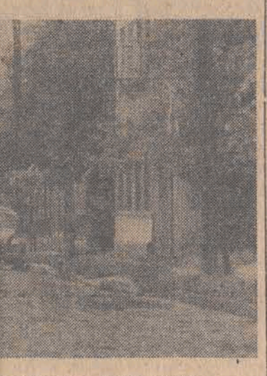
Ulica Tużyńska jeździ się jeszcze po „kociach łbach”.