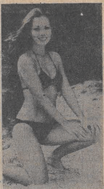
Ona uśmiecha się do nas, więc i my uśmiechnijmy się do niej...