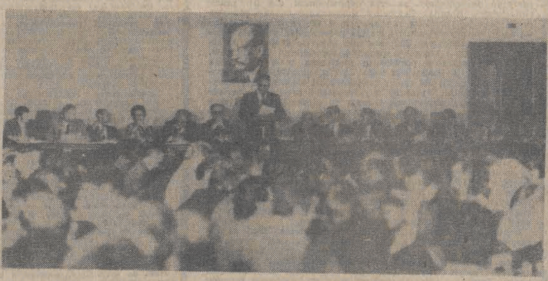
N/z: fragment rozpoczęcia obrad.

WE WTOREK 11 BM. ZEBRAŁ SIĘ W WARSZAWIE NA II PLENARNYM POSIEDZENIU KOMITET CENTRALNY POLSKIEJ ZJEDNOCZONEJ PARTII ROBOTNICZEJ, NA PORZĄDKU DZIENNYM OBRAD — KTÓRYM PRZEWODNICZYŁ I SEKRETARZ KC PZPR — STANISŁAW KANIA: AKTUALNE PROBLEMY I PRZECIWDZIAŁANIE POGARSZAJĄCEJ SIĘ SITUACJI SPOŁECZNO - EKONOMICZNEJ KRAJU; DZIAŁALNOŚĆ PARTII PO IX NADZWYCZAJNYM ZJEJZDZIE PZPR I ORGANIZACJA PRACY KOMITETU CENTRALNEGO.