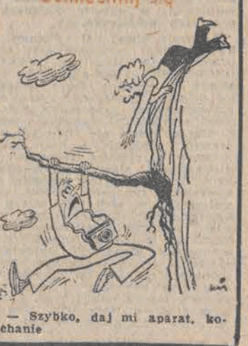
Szybko, daj mi aparat, koehanie

Tako sobie myśli Losem człowieka jest człowiek.