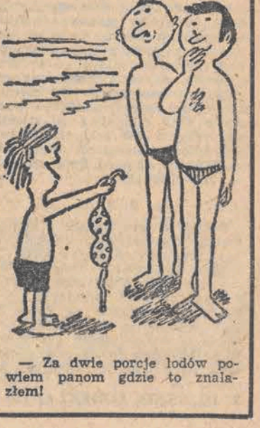
— Za dwie porcje lodów powiem panom gdzie to znalazłem!

W piątek w ZSSR wprowadzono na orbitę okołozemską kolejnego sztucznego satelity Ziemi z serii „Kosmos” o numerze porządkowym 1305. Na pokładzie znajduje się aparatura przeznaczona do kontynuowania badań przestrzeni kosmicznej. Aparatura pokładowa funkcjonuje normalnie.