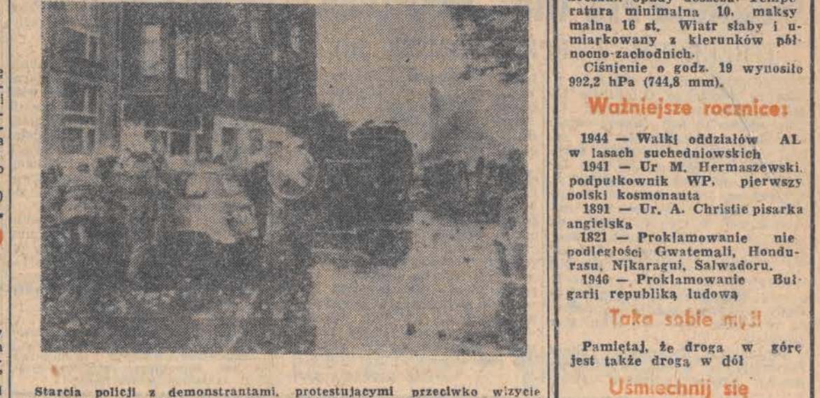
Starci policjanci z demonstrantami, protestującymi przeciwko wizycie sekretarza stanu USA, A. Haiga w Berlinie Zachodnim.

(TELEKSEM Z PFFF GDAŃSK 81) Jury pod przewodnictwem Kazimierza Kutza rozdzieliło festiwalowe laury „Złote Lwy Gdańskie” (65 tys. złotych) przypadły w udziale Agnieszce Holland za film „Gorączka”, zrealizowany na podstawie „Dzień jednego podniku” A. Struga. Ten obraz uważano od początku za kandydata do nagrody choć nie głównej. Szczególnie wiele pochwał wpisywali tu widzowie na konto roboty reżyserskiej podkreślano perfekcję w sposobie obrazowania fabuły tworzenia filmowego klimatu epoki. Najwyższą ocenąjącą film historyczny nagrodę specjalną przyznano ex aequo twórcom dwu filmów spośród tych, które mają staż na półkach, w swoim czasie nie dopuszczonych do rozpowszechniania. Laureatami zostali Krzysztof Kieślowski za „Spokój” i Antoni Krauze — „Meta”. Oba filmy powstały pod firmą telewizyjną. Trzy nagrody główne „Srebrne Lwy” otrzymały „Dreszcze” Wojciecha Marczewskiego, „W biały dzień” Edwarda Żebrowskiego i „Wahadełko” Filipa Bajona. „Brazowe Lwy Gdańskie” dostał za debiut Juliusz Machulski reżyser filmu „Vabank”. Laur aktorski przypadł w udziale Januszowi Gajdosowi, (który wspólnie zagrał w „Wahadełku”). Ze szczególnym zadowoleniem informuje o nagrodzie za rolę kobiecą, (Dalszy ciąg na str. 2)