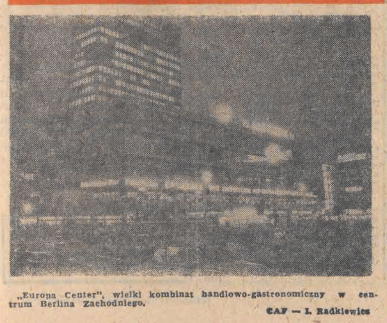
„Europa Center”, wielki kombinat handlowo-gastronomiczny w centrum Berlina Zachodniego.