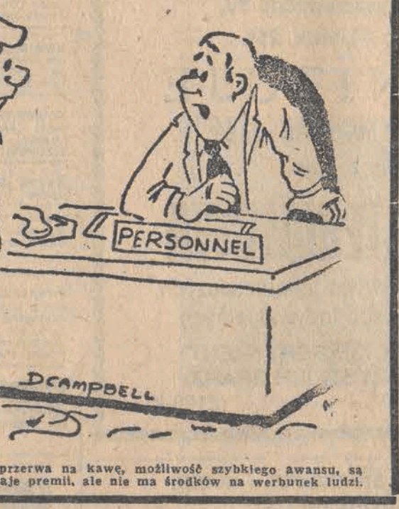
Tak, jest u nas przerwa na kawę, możliwość szybkiego awansu, są podwyżki i różne rodzaje premii...