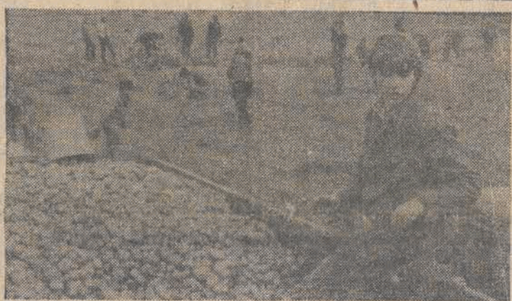
Na polach PGR woj. zielonogórskiego trwa akcja ziemniaczana. Pomagają żołnierze, uczniowie oraz ekipy z różnych zakładów pracy. N/Z: uczniowie Zespołu Szkół Rolniczych w Iłowie Zagajskim na polu PGR Borów.