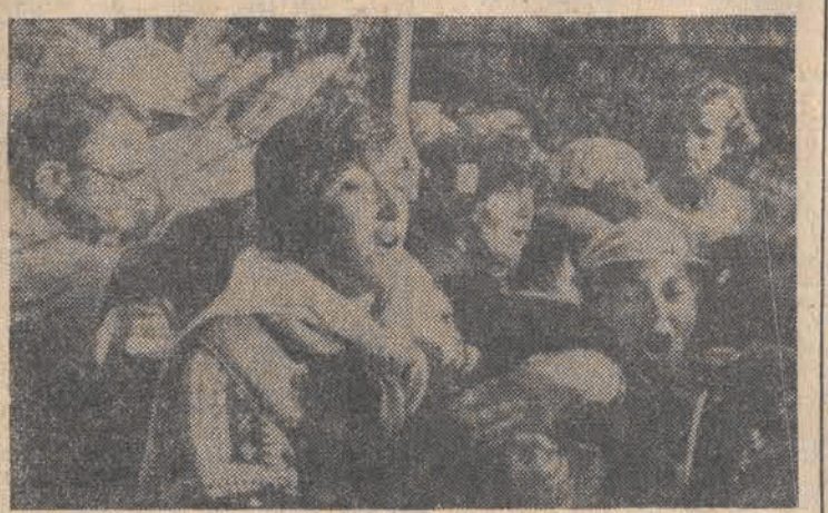
W St. Luis Obispo w Kalifornii odbyła się demonstracja przeciwko elektrowni atomowej.

Fala chłodnego arktycznego powietrza dotarła w Sudety; najzimniej jest w szczytowych partiach Karkonoszy. 17 bm. od rana termometr na Śnieżce wskazywał zero stopni, meteorolodzy nie wykluczają w ciągu najbliższej doby możliwości opadów śniegu w Karkonoszach. W Tatrach nastąpił dość gwałtowny atak zimy. W czwartek, 17 bm. śnieg zalegał w górach już powyżej 1400 m. Na Raspinowem Wierchu dyżurny obserwatorium meteorologicznego notował pokrwyte śnieg o grubości 33 cm. mełe, przelotne opady śniegu oraz 2 st. mrozu. Pogoda sprawiła, że w całym Tatrach gwałtownie pogorszyły się warunki turystyczne. Na szczęście meteorolodzy przewidują w najbliższym czasie ocieplenie i poprawę pogody.