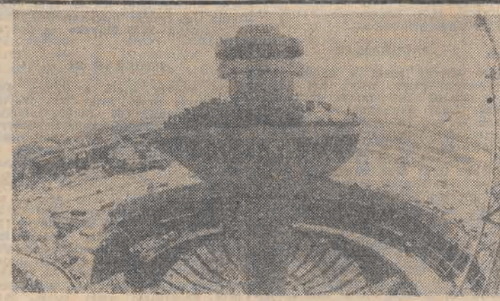
Ponad milionowy Erewan, stolica Armenii wzbogacił się niedługo o dwie wielkie inwestycje — nowe lotnisko i centrum widowiskowo-sportowe...