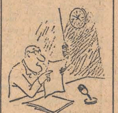
— Tyle o pogodzie, a teraz przegnozy strajkowe na jutro... (PAP)