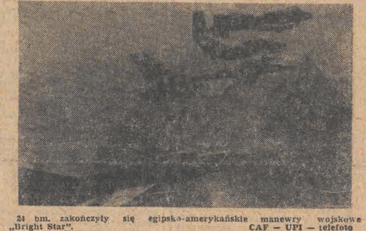
24 bm. zakończyły się egipsko-amerykańskie manewry wojskowe „Bright Star”.

W najbliższym czasie kontynuowane będą rozmowy między władzami wojewódzkimi a delegacją Zarządu Regionu NSZZ „Solidarność” na temat problemów będących przedmiotem konfliktu w lubelskiej oświacie, który został zainicjowany przez Sekcję Oświaty i Wychowania NSZZ „Solidarność”. (PAP)