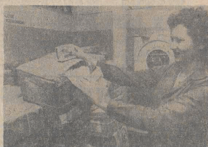
Do Okręgowego Urzędu Przewozu Poczty w Szczecinie trafiła paczka głównie z krajów zachodnich. Codziennie także w wolne soboty „pracuje się” około 3 tys. paczek. N/z: 30 proc. paczek przychodzi w uszkodzonym stanie.