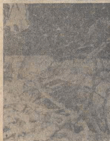
Nad Bostonem przeszła 6 bm. zamięć śnieżna, która sparaliżowała ruch w mieście. N/z: polamane gałęzie drzew na jednej z ulic.

Członek Biura Politycznego KC KPZR i minister spraw zagranicznych Związku Radzieckiego, Andriej Gromyko przyjął we wtorek ministra stanu w Tymczasowym Rządzie Jedności Narodowej Czadu, Adama Barke Mahamata Nura, który przebywał w Moskwie na czele misji dobrej woli. Wymieniono poglądy na niektóre sprawy międzynarodowe, w tym także na temat sytuacji w Afryce Środkowej i wydarzeń związanych z Czadem.