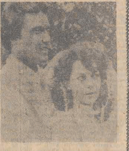
N/z: Natalia Wood z partnerem. Walke-rem w czasie realizacji jej ostatniego filmu „Brainstorm” („Burza mózgow”).