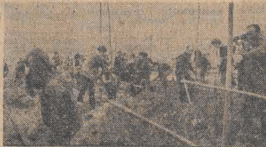
To zdjęcie pochodzi z Mauryta Hiszpańskiego dzieci wraz z rodzicami tłumnie uczestniczą w społecznej akcji sadzenia drzewek.

Zbliża się czas wiosennego sadzenia drzewek, a zarazem termin naszej akcji. Idea pozostała niezmienna. Sądymy, że można również liczyć na współorganizatorów. Apelujemy, by włączyli się do naszej akcji samorządy mieszkańców. Może narodzi się nowe pomysły uatrakcyjnienia „Zielonego świadectwa urodzenia”, gdzie przecież nie chodzi tylko o ilość posadzonych drzewek, ale przede wszystkim o inicjatywę mieszkańców i wywołanie uśmiechu dzieci spoglądających dumnie na „swoje” drzewo i topole rosnące razem z nimi. (Jotak)