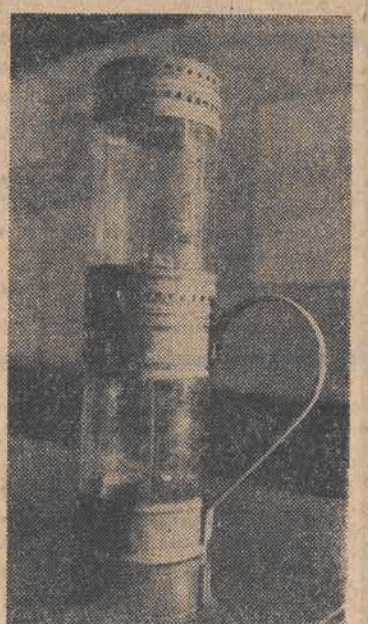
Na zdjęciu: rekonstrukcja lampy naftowej zbudowanej wg pomysłu Łukasiewicza.

P ierwsze bloki, które zostały w początkach lat pięćdziesiątych wznieszone na Bałutach — były blokami kwaterunkowymi. Kwaterunkowymi są do tej pory całe osiedla, takie, jak: Kurak, Rokicie, Zubardzi, część Dąbrowy, część Kozin, część Dołowy.