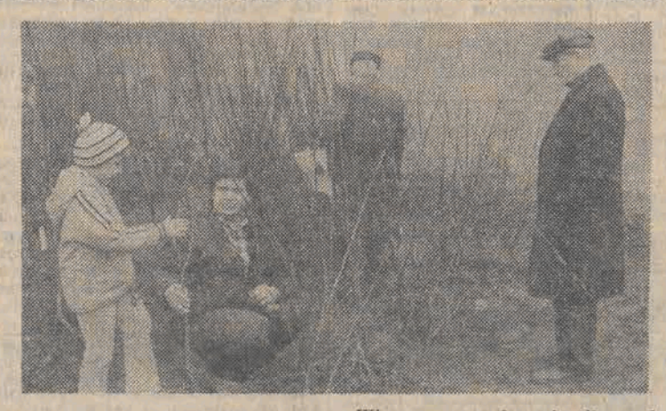
Wiosenna pogoda ożywiła ruch na łódzkiej działościach pracowniczych. Wczoraj rozpoczęła swoją handlową działalność popularny punkt sprzedaży materiału szkol-karskiego i nasion ogrodniczych przy Bałuckim Rynku.

Jednym z istotnych problemów wprowadzanej aktualnie w życie reformy gospodarczej jest polityka zatrudnienia. Problem ten omawiano wczoraj na cotygodniowym posiedzeniu łódzkiej kadry kierowniczej.