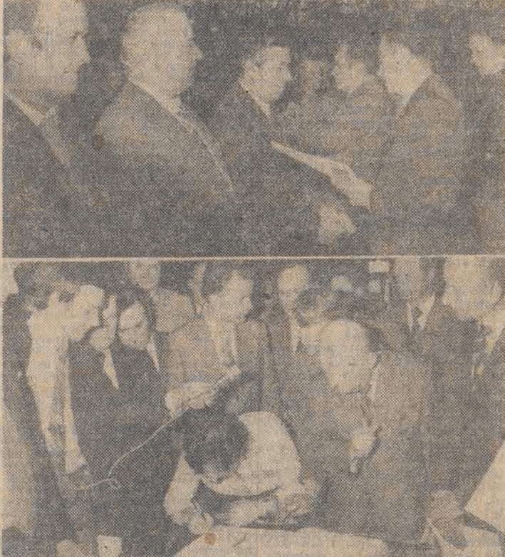
Na zdjęciu u góry — dekoracja Honorowymi Odznakami Miasta Łodzi... Na zdjęciu u dołu — wpis do Honorowej Księgi Przewodników Czynu Produkcyjnego.