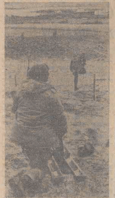
Wojska argentyńskie na Falklandach Malwinach zajmują nowe pozycje obronne na jednej z wysp po inwazji komandosów angielskich.

Doniesienia napływające z Wysp Falklandzkich — Malwińskich na temat rozwoju wydarzeń militarnych są w dalszym ciągu sprzeczne. Argentyna i Wielka Brytania całkowicie odmiennie relacjonują przebieg i wyniki walk o sporny archipelag. W ocenie niektórych zagranicznych ekspertów, desant kilku tysięcy brytyjskich żołnierzy, dokonany w ub. piątek i następująca po nim eskalacja walk na lądzie, morzu i w powietrzu, stanowią już „przedostatni akt wojny”.