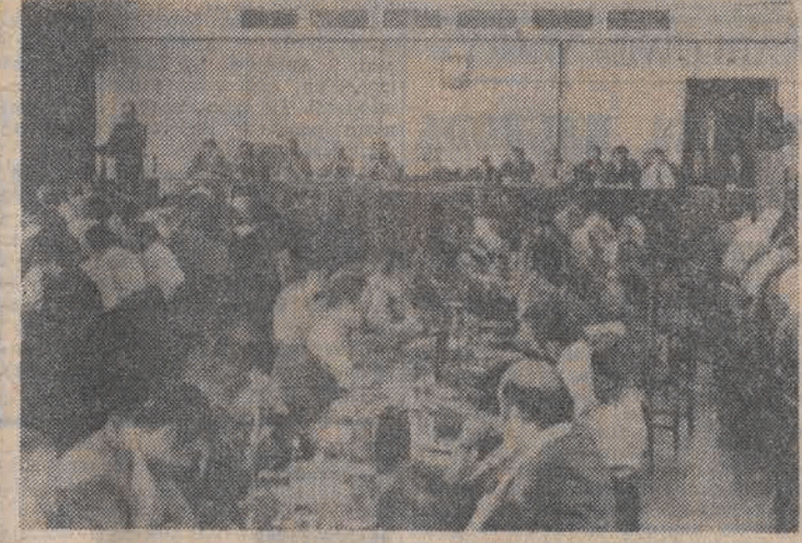
W/ni przemawia I sekretarz KC PZPR, gen. Wojciech Jaruzelski.

15 BM. W WARSZAWIE ROZPOCZĘŁO SIĘ IX PLENARNE POSIEDZENIE KOMITETU CENTRALNEGO POLSKIEJ ZJEDNOCZONEJ PARTII ROBOTNICZEJ, POSWIĘCONE WĘZŁOWYM PROBLEMEM MŁODEGO POKOLENIA.